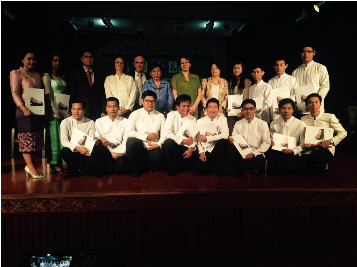
Légende : Remise des diplômes

Dans la continuité du colloque, la matinée du 18 décembre a été consacrée à une cérémonie de remise des diplômes des étudiants de l'URBA parmi lesquels les 15 étudiants khmers de la première promotion de la double licence URBA/INALCO.