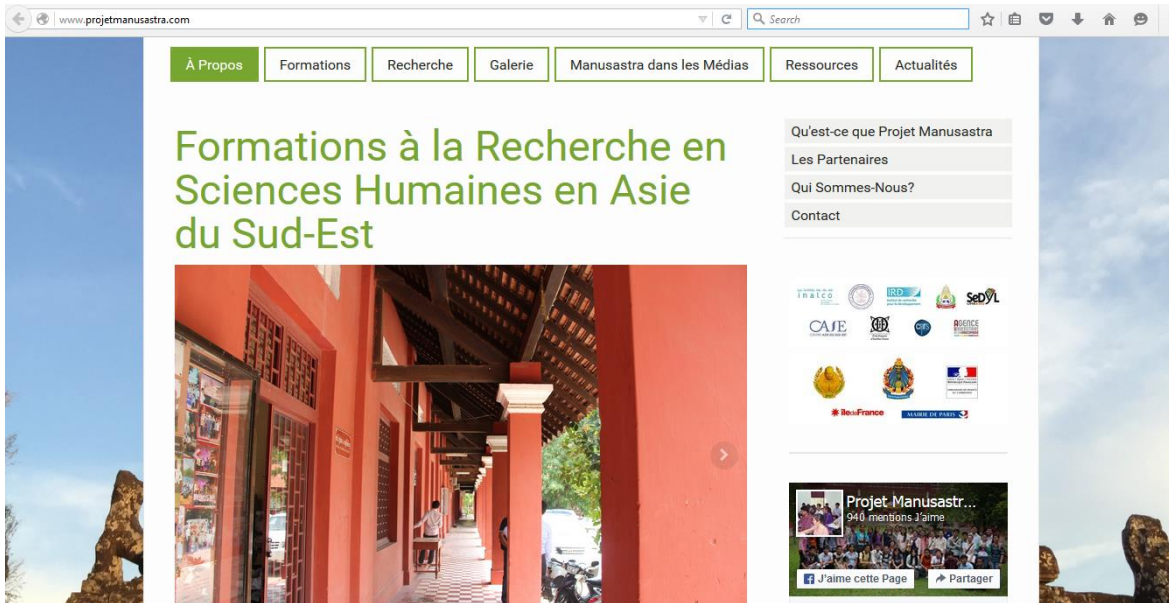
Légende : Visuel du site internet

Un site internet dédié au projet a vu le jour en mai 2015. Le site internet se divise en plusieurs catégories : « à propos, Formations, recherche, galerie, Manusastra dans les médias, ressources et actualités. »